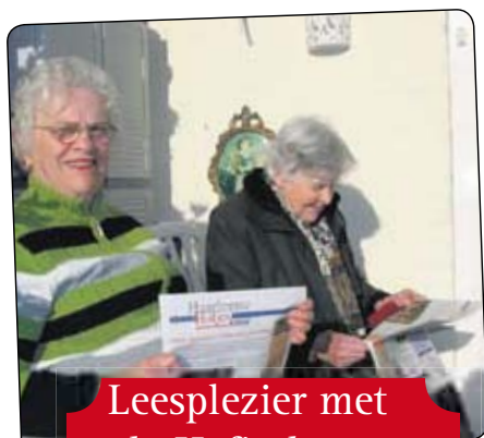
Leesplezier met de Hofjeskrant

De Haarlemse Hofjeskrant kwam mede tot stand dankzij (financiële) steun van het bestuur van de hofjes Codde en Van Beresteyn.